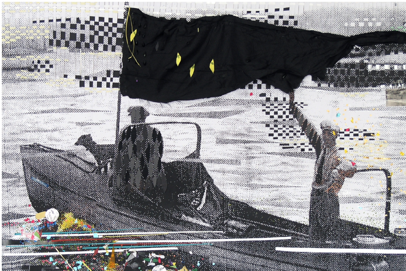
Kirstine Roepstorff Out bound , 2005. Mixed-media collage, 166x155 cm (detail).

I believe in connections, relations, and that we are constantly affected by the contexts of which we form a part. I insist