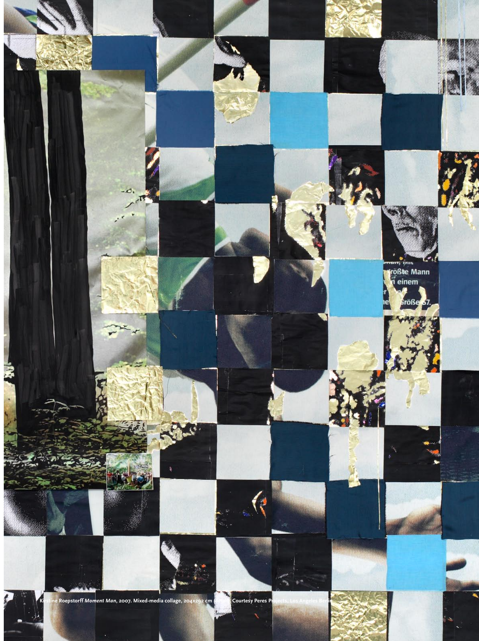
Kirstine Roepstorff Moment Man , 2007. Mixed-media collage, 204x292 cm (detail).