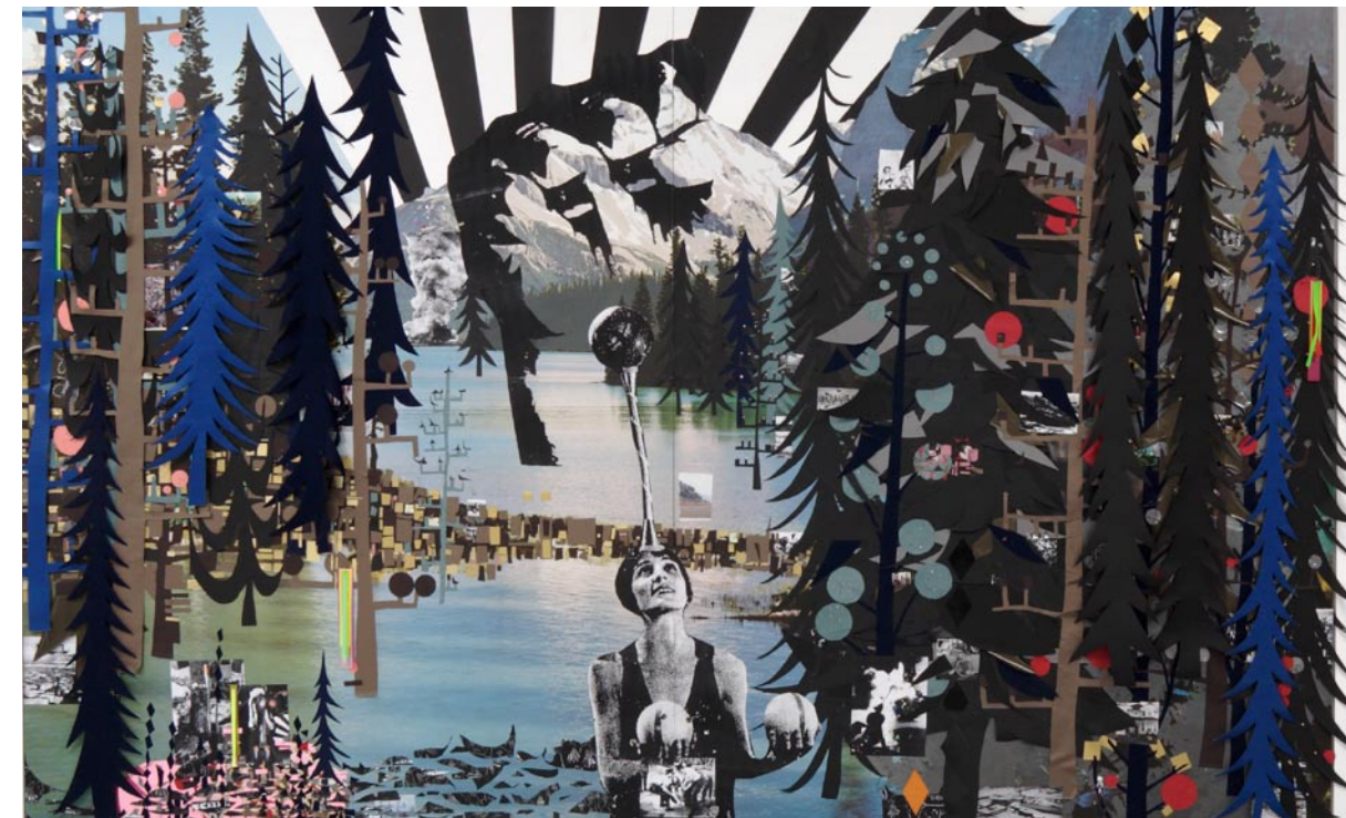
Kirstine Roepstorff If Balance Stops and Asks Why, Balance Will Die , 2006. Mixed-media collage, 274x388 cm (detail).