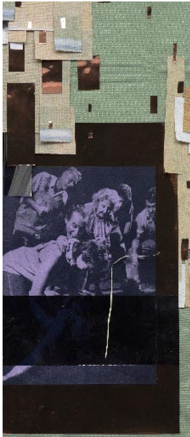
Kirstine Roepstorff Six Who Observe and One Who Suffers , 2007. Mixed-media collage, 97x55 cm (detail).

Med teateret forsøger jeg at tage den 'fastlåste' collage ned fra væggen og placere den i rum. Jeg håber, at den kan åbnes op på ny, så det rum, der før var fastlåst, kan få plads til at ånde. Jeg tillader mig her at give slip på en del af den kontrol, som jeg ellers har