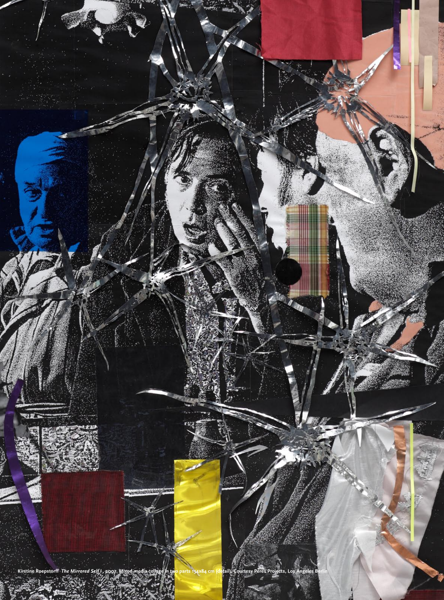
Kirstine Roepstorff The Mirrored Self I , 2007. Mixed-media collage in two parts 134x84 cm (detail).

der allerede er defineret. Her tænker jeg på rummet mellem træerne i en skov eller husene i en by. Mellem vores konventionelt fastsatte værdier eller definitioner. Det er 'frie rum', hvor man kan navigere ud fra det allerede fastsatte, normsættende og identificerede i verden. Lidt på samme vis, som når jeg arbejder med collagen. Jeg tager udgangspunkt i billeder, situationer og historiske begivenheder, som vi med vores vestlige perceptionsapparat kan genkende og dermed kan finde vej i eller afkode.