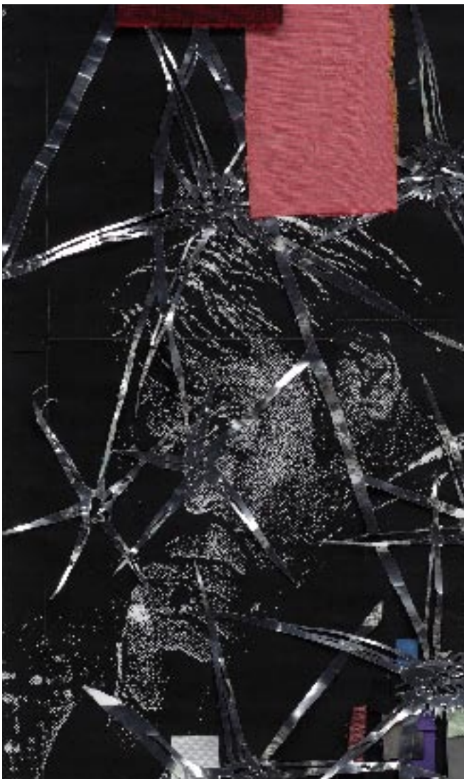
Kirstine Roepstorff The Mirrored Self II , 2007. Mixed-media collage in two parts, 150,5x100,5x20,5 cm (detail).

at de er værd at tage vare på. Ligesådan er collagen kun af værdi for dem, der værdsætter den nye symboladning, for andre er en collage måske blot en samling trash . En collages levetid er kort, hvis ikke der er nogen, der griber den og dens betydninger og tager den med ud i verden.